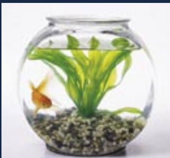
Capacité d'un aquarium : 4 litres

Aliant Alphabétisation Nouveau-Brunswick Assurance Goguen Protection Insurance Assurance Jones Ausurion Canada Banque Nationale du Canada Banque Scotia C103/ XL96 Centre national de prévention du crime CIBC Wood Gundy Clinidata Corporation Club Kiwans de Moncton Club Lion de Moncton Club Rotary de Moncton et Club Rotary Moncton West et Riverview Comité des détenus de Dorchester Conseil d'administration et personnel de FJM DCSDA Holdings Deloitte and Touche Delta Beauséjour Développement des ressources humaines Canada Dooly's Fenety Marketing Services Fondation Harrison McCain Fondation McCain Fondation RBC Fonds de renouvellement de système de justice pour les jeunes, ministère de la Justice du Canada Fonds spécial d'intervention de Centraide Groupe Atlas Groupe Co-operators limitée Home Dépôt Industrielle Alliance J.D. Irving, Limited Le Château Moncton Le groupe Bristol Le Groupe Irving de Moncton Lighthouse Communications Major Drilling Group International Million Dollar Round Table Canadian Charitable Foundation Ministère de la Santé du Mieux-être, Division de la santé mentale Ministère de la Sécurité publique Ministère des Services familiaux et communautaires Moncton Area Council of Churches Mr. Shredding Waste Management Newco Construction Project des sans-abri de l'IPAC Province du Nouveau-Brunswick Riverview Lions Club Société des loteries de l'Atlantique United Commercial Travelers Ville de Moncton Wesley Memorial United Church Whitehill Technology