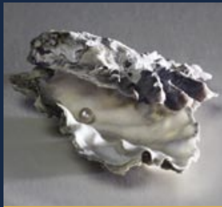
Capacité d'une haître : 1 perle

En termes simples, l'expression signifie ne pas devenir un adulte productif et en santé. Un « jeune à risque » est menacé par divers facteurs qui nuisent à son apprentissage, à ses capacités d'adaptation et à son jugement. Il est ainsi plus probable qu'il fasse des choix qui le marginaliseront davantage et qui se solderont souvent par des conséquences désastreuses à court et à long terme.